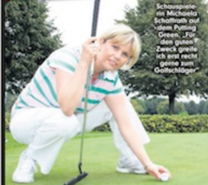
Schauspielerin Michaela Schaffroth auf dem Putting Green. „Für den guten Zweck greife ich erst recht gerne zum Golfschläger“